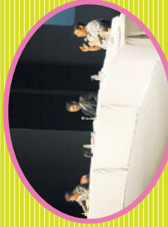
2009年11月18日～19日 第48回全国消費者大会