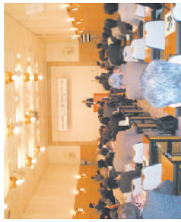
日独消費者フォーラム

私たちはCI(国際消費者機構)の一員として世界の消費者団体と連携しています。日独消費者フォーラム等を開催し、世界の消費者問題や消費者行政のあり方などについて認識共有を図っています。