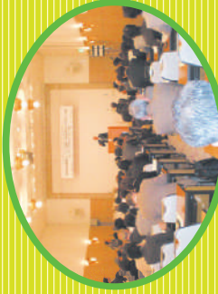
2010年3月3日～4日 第3回日独消費者フォーラム

全国消団連は、消費者庁、ペリソド独センター、フーワード・エンベール財団とともに第3回日独消費者フォーラム「消費者・生活者の視点に立つ行政への転換」～日独両国の消費者政策の現状と課題～を開催しました。