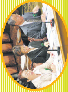
2009年5月7日 参議院(消費者問題に関する特別委員会)